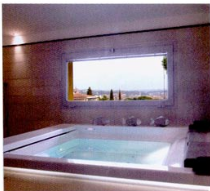
IN QUESTA PAGINA: IL BAGNO CON LA VASCA IDROMASSAGGIO (TEL CO), LA RUBINETTERIA È DI ZAZZERI, I SANITARI DI CATALANO.

riserimento al genius loci). Gli arredi sono anch'essi in legno, come le porte di accesso agli altri ambienti e le finiture dei locali di servizio. Il legno prosegue anche sugli armadi, quello più importante cinge tutta la parete del living, decorando il salone come una boiserie. Di fronte, invece, il perimetro che affaccia sul grande terrazzo è arricchito da tre grandi porte-finestre che incorniciano una superba vista della città e il paesaggio collinare sullo sfondo. In certi punti il trattamento delle pareti cambia diventando carta da parati monocromatica (Flamant). Al primo piano un accogliente salottino sottolinea il senso di privacy che si è voluto dare a questa zona, mentre, sullo stesso livello, la cucina è delimitata su un fianco dalla scala in legno che funge anche da comodo elemento contenitore per frigorifero, zona cottura e armadiature varie. La camera padronale si affaccia sul terrazzo, sotto la falda di copertura, offrendo un senso di continuità con l'esterno. Concetti antichi che si ripropongono con riferimenti simbolici ed eludono la funzione dell'oggetto: un mobile che separa la zona pranzo dal living, il focolare che è stato sostituito da un monitor, un armadio dalle linee pulite che funge da contenitore. 🏠